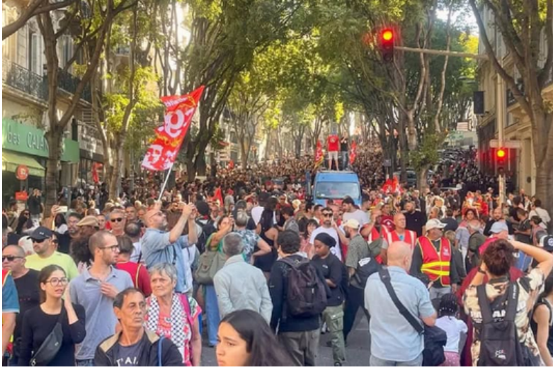
مشاركة واسعة وروح ثورية

حركة "أحجب كل شيء" هي حركة لا قيادية اكتسبت الزخم خلال الصيف على وسائل التواصل الاجتماعي والمحادثات المشفرة. حظيت بدعم من النقابات العمالية الكبرى مثل CGT و SUD ، وكذلك من أحزاب اليسار، بما في ذلك حزب "فرنسا الأبية" (LFI) بزعامة جان لوك ميلينشون .